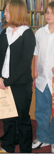
Spotkania autorskie, wystawy, podsumowania konkursów, uroczystości rocznicowe w PBW w Kielcach